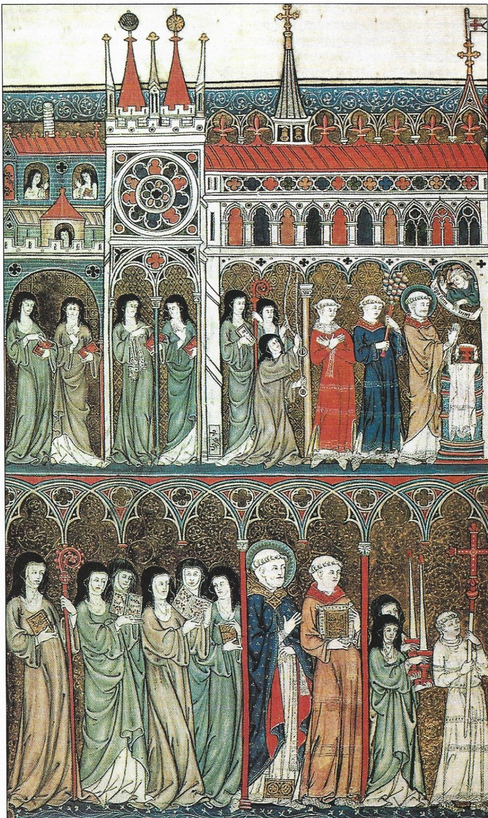
A kettős kolostor szimbolikus ábrázolása 1300 körül. A férfi szerzetesek feladata a liturgia végzése. Az apátnő kezében pásztorbot, mint a püspököké vagy a férfi apátoké

Női monostorokkal találkozunk már a szerzetesség kialakulásának kezdetén. A 4. századi Egyiptomban az első szerzetesi közösségek alapítója, Pachomiosz házat épített – a férfimonostor mellett – Mária húga és társnői számára. A 6. században Nyugaton is megjelentek az apácakolostorok.