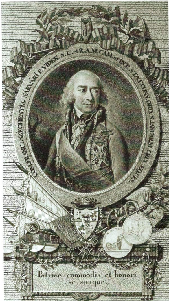
Széchényi Ferenc gróf arcképe. Czetter Sámuel rézmetszete, 1798.

Ferenc és a „keszthelyi mágnes” – édesanyja nevezte így egy levelében a családjáéhoz visszaköltöző, özvegy Julianát – hamar tisztába jöttek egymással, ám jó másfél esztendőbe telt, mire a Festetics szülők ellenkezését sikerült legyőzniük. Ezután indult a csata a pápai engedély kieszközléséért, mert a