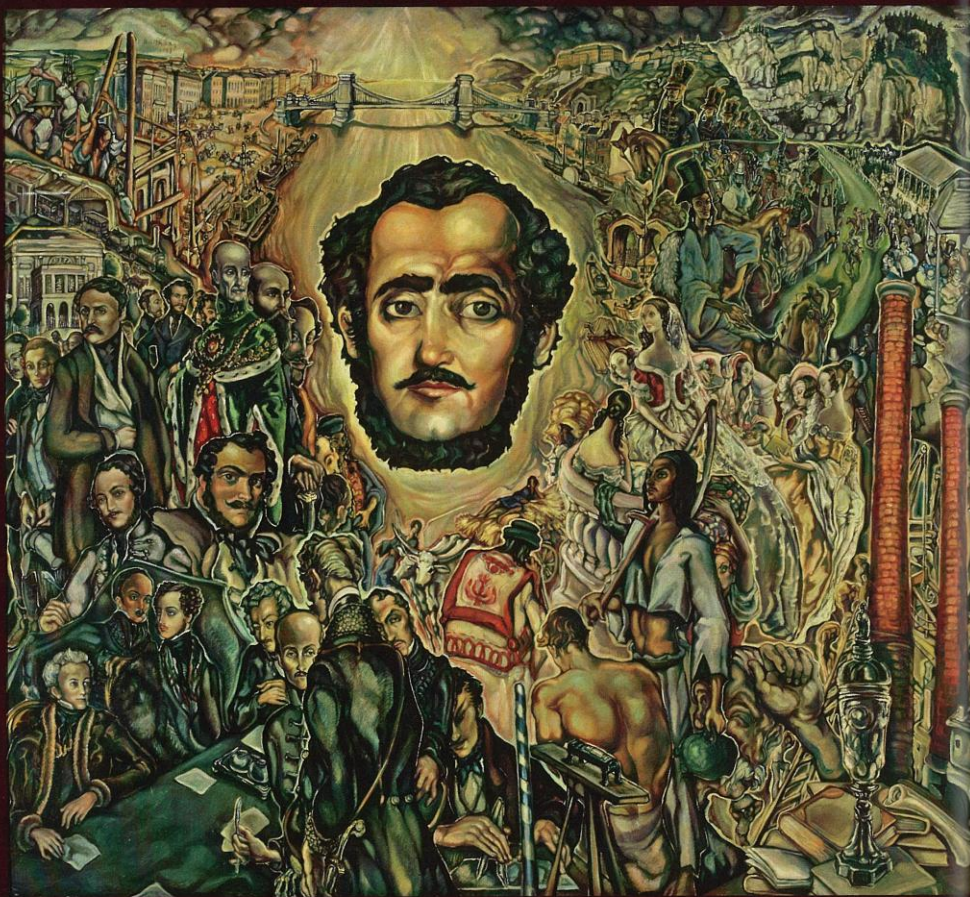
Széchenyi István apoteózis. Batthyány Gyula olajfestménye, 1941.

A késő szecesszió, a szürrealizmus és az art deco hatásait saját, különleges stílusban ötvöző festőművész, Batthyány Gyula gróf – Batthyány Lajos dédunokája, Andrássy Gyula unokája – nagy tisztelője volt Széchenyinek. Amellett, hogy nagyszerű grafikai sorozatot szentelt életének és munkásságának, megdicsőülését ezen a különlegesen gazdag festményen fogalmazta meg. A Duna vonalára mintegy égi fény árad a Lánchíd – a legemblematicusabb Széchenyi-alkotás – felől, s a folyó zöldes-aranyos vizében fürdik a „legnagyobb magyar” kissé idealizált, életkorát tekintve az Akadémia alapítása körüli időszakhoz közeli portréja. A pesti oldalon korának és életútjának neves szereplőit alkotnak burjánzó, hul-