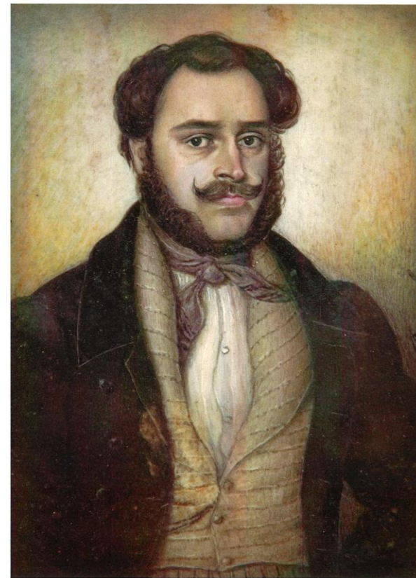
Wesselényi Miklós. Elefántcsont, Johann Ruprecht vízfestménye, 1839. Széchenyi reformprogramjának kialakításában hozzá méltó társa volt az erdélyi báró, de útjuk idővel elvált, mert Wesselényi felismerte, hogy az átalakulás politikai vezetését nem lehet monopolizálni, hanem a köznemesi elite kell bízni. Előbb azonban el kell érni, hogy a sérelmi ellenlétséget modern, liberális reformpolitikával váltsa fel.

Amikor állapota az 1850-es évek közepére „feltisztult”, mi több, az évtized végére magas színvonalú értelmiségi tevékenységre lett képes, ám az erről író biográfusok véleménye újra megoszlik. Beteg volt-e, vagy beteg maradt-e Széchenyi ebben a korszakában is, gyógyítási színhely vagy csupán politikai búvóhely volt-e számára Döbling? A dilemma többek között azért maradt eldöntetlen, mert ekkoriban még hiányzott a sok évtizedes megfi-