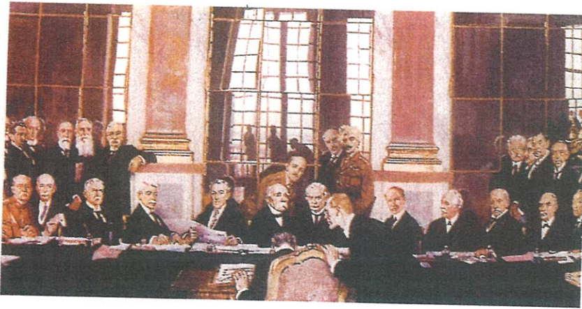
Békekonferencia Versailles-ban, 1919. Középen balról jobbra: Orlando, Wilson, Clemenceau és Lloyd George

Huszár Károly (1882–1941) • Néptanító, politikus, miniszterelnök 1919. november és 1920. március között. 1910-tól a Katolikus Néppárt képviselője, 1919 után a KNEP egyik vezetője. Az 1919 novemberében megalakult koalíciós kormány miniszterelnöke. 1920 és 1928 között a parlament tagja. 1929-től 1934-ig az Országos Társadalombiztosítási Intézet (OTI) elnöke, és a felsőház tagja. Ezt követően az Actio Catholica szociális szakosztályának elnöke. [GJ]