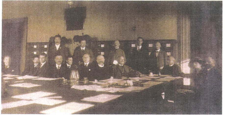
A Nemzeti Tanács, 1918. november

A Magyar Nemzeti Tanács programját – emlékeztetve 1848. március 15. forradalmi 12 pontjára – ugyancsak 12 pontba foglalva október 25-én hozták nyilvánosságra. A deklaráció első és legfontosabb követelése a háború azonnali befejezése, a fegyverszünet, illetve a béke megteremtése volt: az annexió és hadisarc nélküli igazságos békéé. A háború gyors lezárásának követelését összhangba kellett hozni a nemzetiségi kérdés megoldásával és az ország területi integritásának megőrzésével, a belpolitikában pedig a polgári demokrácia berendezkedésének követelményeivel. Mindez az ország teljes nemzeti függetlenségének megteremtésével volt csak elképzelhető. A konkrét követelések között szerepelt az általános, egyenlő és titkos választójog alapján történő választások (alkotmányozó nemzetgyűlés);