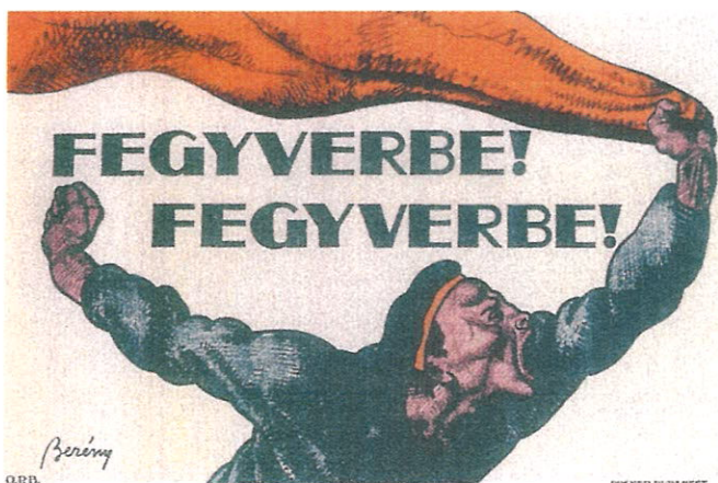
Fegyverbe! Plakát, 1919

intervencióra azonban nem került sor. Ehelyett indultak meg a szomszédos országok csapatai. A támadás csehszlovák és főleg román oldalról volt veszedelmes. Május első napján a csehszlovák és román haderő Máramarosnál találkozott, ugyanekkor a románok már elérték Szolnokot.