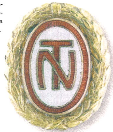
A Nemzeti Tanács jelvénye

szágokban élt. Az emigrációban szoros kapcsolatokat alakított ki a baloldallal, a kommunistákkal is. 1923-ban magyarországi vagyonát elkobozták és alapítványra tették. 1946–1947 folyamán hazatért, 1947-től párizsi magyar nagykövet. 1949-ben – a Rajk-per miatt – lemondott, és ismét emigrációba vonult. [GJ]