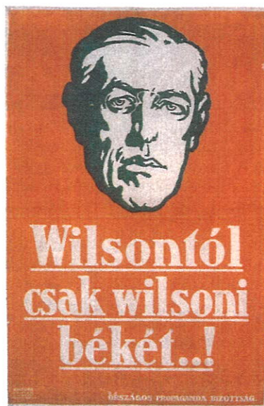
„Wilsonról csak wilsoni békét!” Propagandaplakát, 1919

zetközi gyakorlatnak megfelelően e törvény a létrejövő szolgálatot Külügyminisztériumra , diplomáciai képviselésekre és konzuli hivatalokra osztotta. 1919 februárjában a kiépülő külügyi szolgálatban a kinevezett tisztviselők 44 százaléka korábban a bécsi Ballhausplatzon, a közös külügyi szolgálatban nevelődött. Szakértelmük, nyelvi felkészültségük birtokában az új Külügyminisztériumban ők voltak a hangadók. A korabeli közvélemény ezt kritizálta, mert inkább olyanokat szeretett volna ott látni, akik „magyarabbak”. Az ország vezetői ellenben tisztában voltak azzal, hogy szakembe-